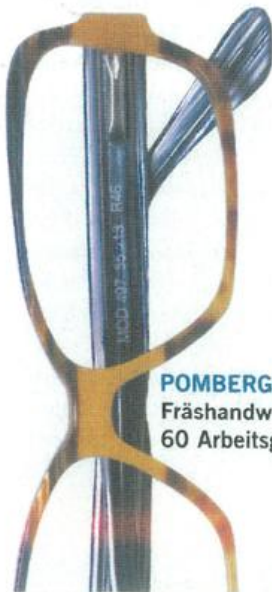
POMBERGER: Fräshandwerk in 60 Arbeitsgängen.

Der 20 Mann starke Betrieb setzt auf einzigartige Werkstoffe und auf Handwerklichkeit statt Massenware. Bügel und Rahmen werden nicht, wie sonst üblich, an großen Kunststoff-Spritzgussmaschinen produziert, sondern vorwiegend aus Baumwollacetat. Dieser sehr hautverträgliche Werkstoff wird aus Platten in bis zu 60 Arbeitsschritten gefräst und warmverformt. Dem Einfallsreichtum in Bezug auf